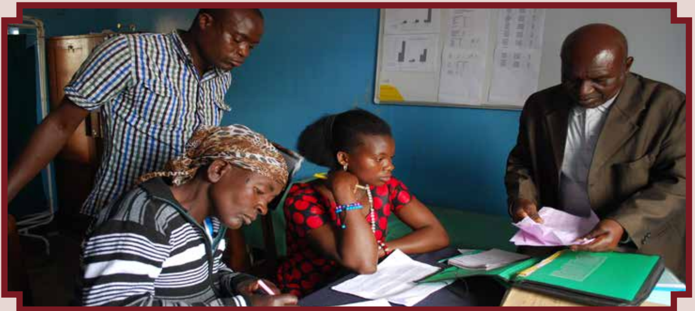
Wajumbe wa timu ya SAM wilayani Kilolo wakikagua baadhi ya nyaraka katika zoezi la SAM lililofanyika wilayani humo.