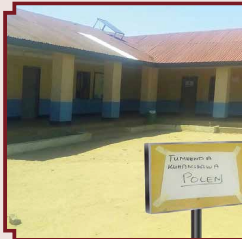
3. Zahanati ya Itaja wilayani Singida, ikionekana kutokuwepo kwa likionekana hakukuwa na utolewaji

Mkutano huu wa wadau wa sekta ya afya nchini hufanyika kila mwaka kwa lengo la kujadili muelekeo wa sekta kwa upande wa sera. Wadau walioshiriki ni pamoja na washirika wa maendeleo, mabalozi kutoka baadhi ya nchi wahisani, sekta binafsi, wawakilishi wa mashirika mbalimbali yanayo jishughulisha na masuala ya afya, wawakilishi wa taasisi za kidini na za kiraia zinazofanya kazi katika sekta ya afya nchini.