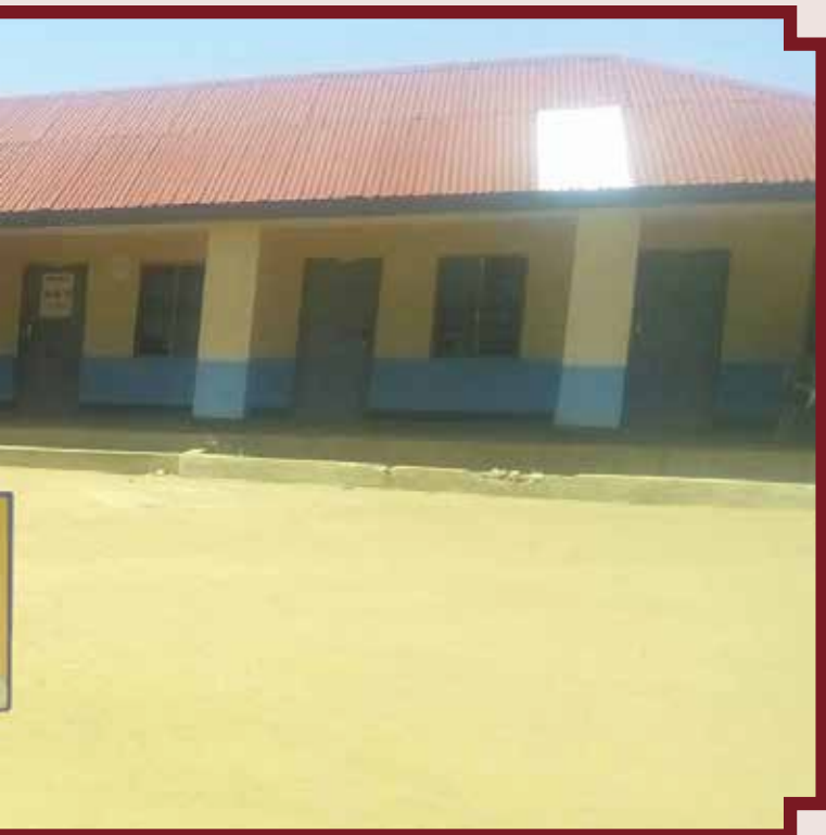
Watumishi kituoni wakati wa saa ya kazi na pembeni ni tangazo wa huduma za afya kituoni hapo.

Kutokuwepo kwa utaratibu mzuri wa kuwawezesha watumishi kuhakikiwa bila kuathiri utoaji wa huduma za afya kumeleta usumbufu kwa wagonjwa waliopo katika baadhi ya vituo. Mfano, mnano Tarehe 13/10/2016, Sikika ilitembelea baadhi ya zahanati za wilaya ya Singida na kukuta zimefungwa. Ukutani kulikuwa na tangazo lililosomeka, “Tumeenda kuhakikiwa. Polen!”