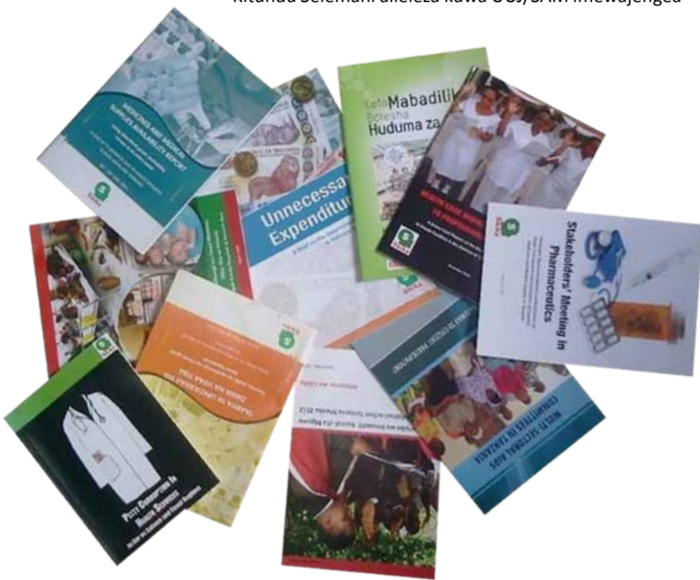
Baadhi ya machapisho yanayopatikana Sikika