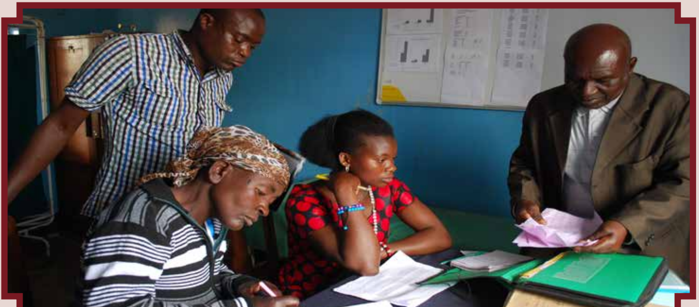
Wajumbe wa timu ya SAM wilayani Kilolo wakikagua baadhi ya nyaraka katika zoezi la SAM lililofanyika wilayani humo.