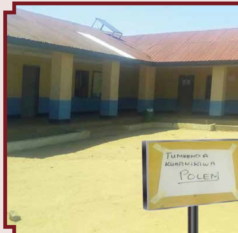
3. Zahanati ya Itaja wilayani Singida, ikionekana kutokuwepo kwa likionesha hakukuwa na utolewaji

Mkutano huu wa wadau wa sekta ya afya nchini hufanyika kila mwaka kwa lengo la kujadili muelekeo wa sekta kwa upande wa sera. Wadau walioshiriki ni pamoja na washirika wa maendeleo, mabalozi kutoka baadhi ya nchi wahisani, sekta binafsi, wawakilishi wa mashirika mbalimbali yanayo jishughulisha na masuala ya afya, wawakilishi wa taasisi za kidini na za kiraia zinazofanya kazi katika sekta ya afya nchini.