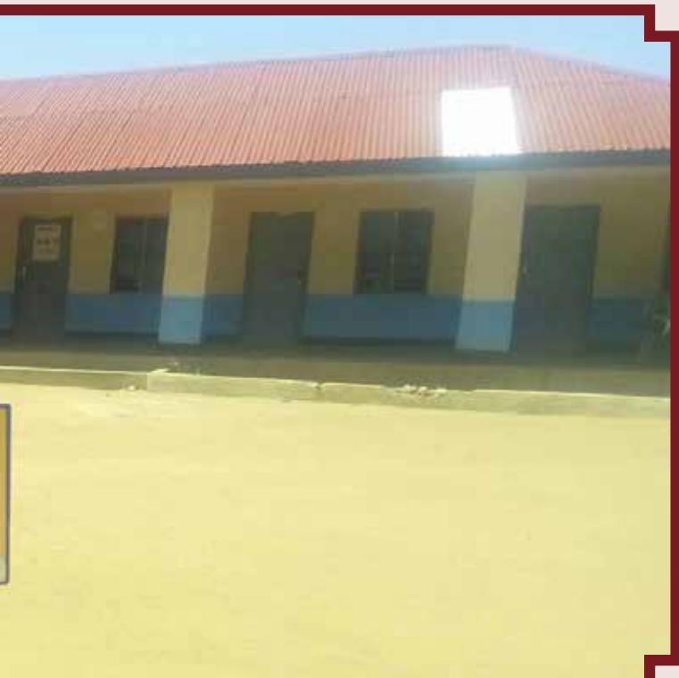
Watumishi kituoni wakati wa saa ya kazi na pembeni ni tangazo wa huduma za afya kituoni hapo.

Kutokuwepo kwa utaratibu mzuri wa kuwawezesha watumishi kuhakikiwa bila kuathiri utoaji wa huduma za afya kumeleta usumbufu kwa wagonjwa waliopo katika baadhi ya vituo. Mfano, mnano Tarehe 13/10/2016, Sikika ilitembelea baadhi ya zahanati za wilaya ya Singida na kukuta zimefungwa. Ukutani kulikuwa na tangazo lililosomeka, “Tumeenda kuhakikiwa. Polen!”